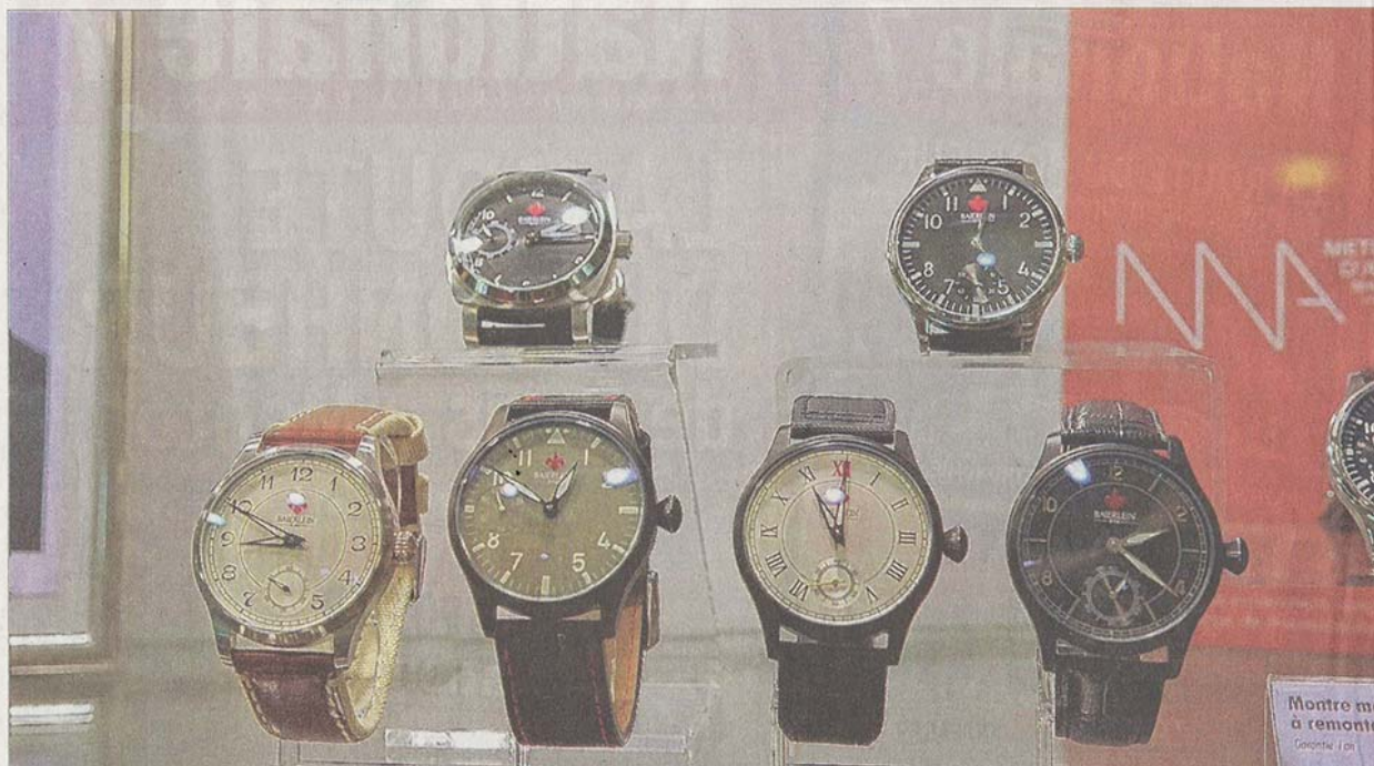
Les montres Baierlein vont redonner un élan à la fabrication française.

Chez les Baierlein, père et fils partagent le même volontarisme audacieux et ils affichent fièrement une montre éponyme sortie de leurs ateliers depuis le mois de mai. « Nous voulions satisfaire une clientèle qui veut acquérir une montre qui soit fabriquée, montée et réglée dans nos ateliers le tout à un prix abordable et avec un service après-vente digne de ce nom. » La marque n'a pas encore fait de publicité mais trouve déjà des clients. « Nous avons 12 modèles qui sont numérotés, c'est la garantie d'un objet personnalisé fabriqué avec le savoir-faire d'artisans qualifiés ».