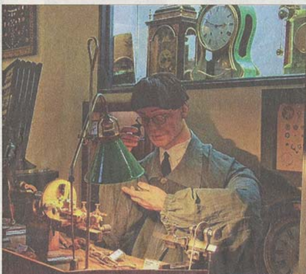
Le mannequin baptisé "Ferdinand" rappelle les ateliers d'autrefois.